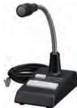
ベース用 スタンドマイクロホン KMC-53