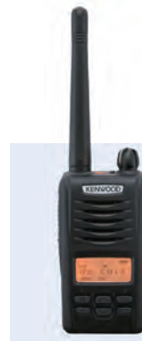
デジタル簡易無線 携帯型登録局対応無線機 D503シリーズ