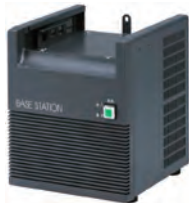
ベース用 スピーカー付き電源 KBS-1